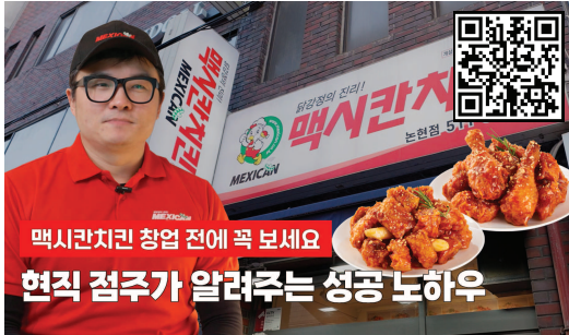
▲ 멕시칸치킨 서울 논현점 인터뷰 영상