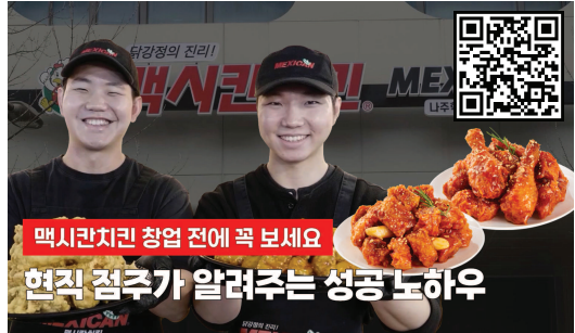
▲ 멕시칸치킨 전남 나주혁신점 인터뷰 영상