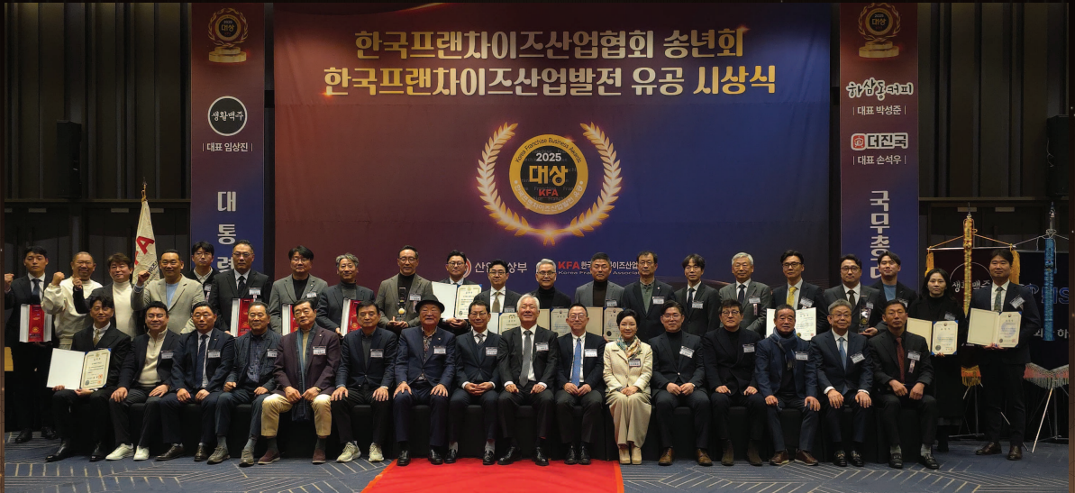
▲ 2025년 한국프랜차이즈산업 발전 유공 산업통상자원부 장관 표창 수상

KOREA CONSUMER SURPRISE BRAND 대한민국 소비자 감동 브랜드 1위