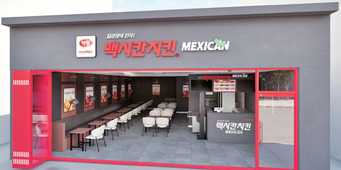
멕시코칸치킨 호프형 매장